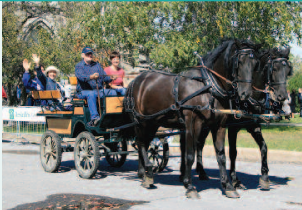
Des visites guidées, à bord de voitures tirées par des chevaux, ont permis à de nombreux visiteurs de découvrir le Petit Village.