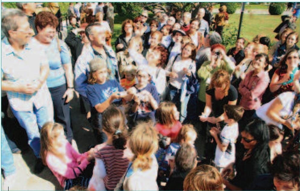
Grands et petits se sont rassemblés afin d'apprécier l'envol des papillons monarques.

Malgré la pluie et le vent, la fête au Petit Village a été un grand succès. Des centaines de visiteurs ont été charmés par la beauté du site et par l'accueil qui leur a été réservé rue Notre-Dame, dans le secteur Le Gardeur. Des animations dynamiques et colorées, des parcours captivants et des activités variées ont contribué à la réussite de l'événement. Déjà, le comité de la fête au Petit Village pense à sa prochaine édition qui se tiendra dans deux ans !