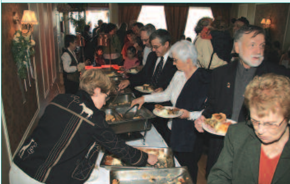
Plusieurs se sont régalés lors du brunch villageois.