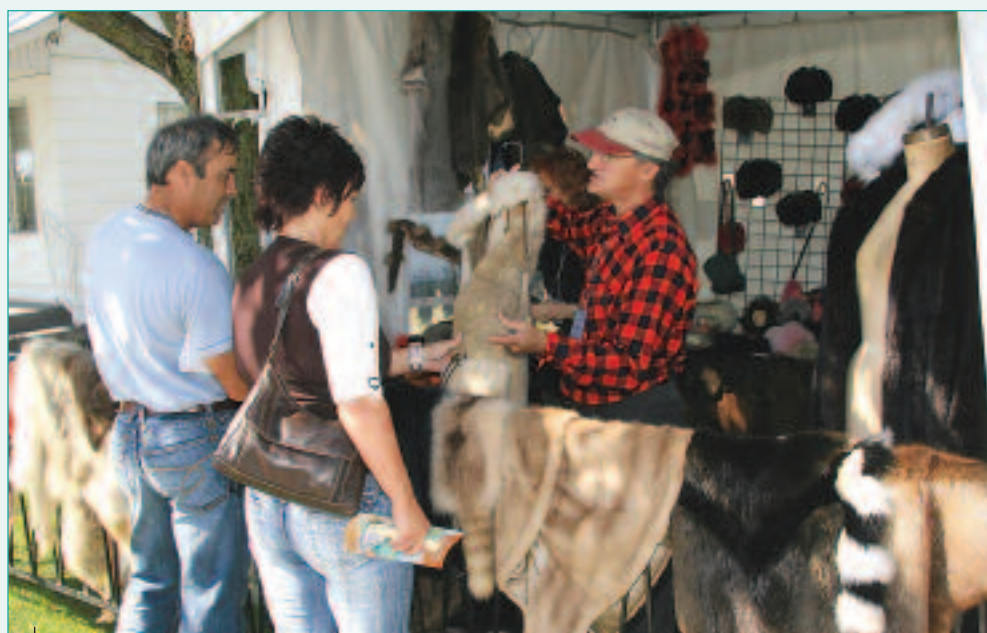
Plusieurs artisans étaient présents afin d'offrir des démonstrations de métiers traditionnels.