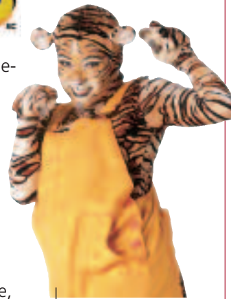
Le personnage peut différer.

Surveillez les journaux locaux afin de connaître les détails du parcours qu'empruntera le père Noël. D'ici là, encouragez vos frimousses à écrire une lettre au Père Noël. Ce dernier les recueillera dans son énorme boîte aux lettres qui sera tirée par des lutins lors du défilé.