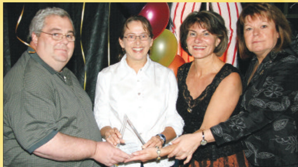
La Ville de Repentigny est fière de remettre son prix Reconnaissance « organisme bénévole de l'année » au club de natation Torpille.

À cette femme dynamique, dont l'esprit d'équipe et de collaboration est reconnue, la Ville de Repentigny est fière d'attribuer son prix Reconnaissance de la bénévole féminine 2006.