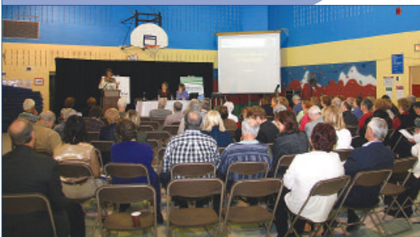
Près de 90 personnes ont assisté à ce premier Forum des aînés repentignois.

Ils étaient près de 90, les aînés repentignois, à participer à un premier forum où ils ont débattu de sécurité, de loisir et d'environnement, mais également d'habitation, de santé et de transport.