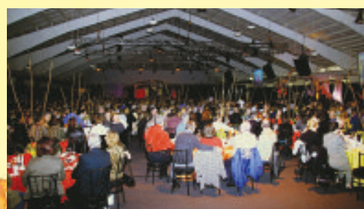
Près de 1000 bénévoles ont assisté à l'événement.