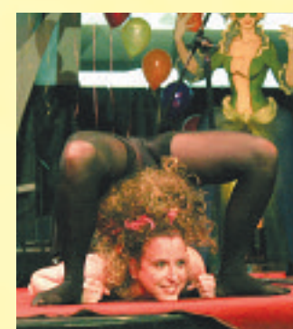
Cette contorsionniste en a mis plein la vue!