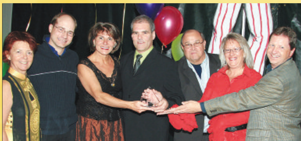
Pour son travail inlassable, la défense de l'intérêt de la communauté et la sensibilisation citoyenne, la Ville de Repentigny est fière d'attribuer son prix Reconnaissance action bénévole de l'année au comité des citoyens de la Presqu'île - Lanaudière

Le club qui compte quelque 150 membres a en outre réaménagé sa plage-horaire pour accueillir des nageurs ayant un handicap ce qui lui a d'ailleurs valu de recevoir une plaque par l'organisation du défi sportif en reconnaissance de son implication dans l'intégration de jeunes handicapés.