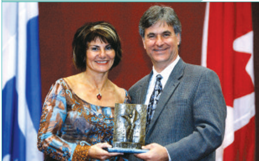
La mairesse de Repentigny et le ministre de l'Éducation, du Loisir et du Sport, Monsieur Jean-Marc Fournier, au moment de la remise.

PRIX DU BÉNÉVOLAT EN LOISIR ET EN SPORT DOLLARD-MORIN