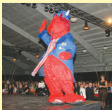
Tison, la mascotte officielle de la 42 e Finale des Jeux du Québec, est venue saluer les nombreux invités.