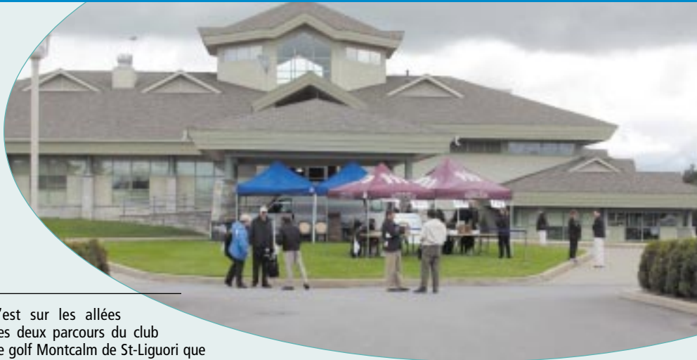
C'est sur les allées des deux parcours du club de golf Montcalm de St-Liguori que les quelque 300 golfeurs ont pris part à ce tournoi amical.

Malgré un ciel parfois menaçant, quelque 300 golfeurs s'étaient donné rendez-vous, le 2 juin dernier, sur les allées des deux parcours du club de golf Montcalm à St-Liguori. Cette journée a encore une fois été couronnée d'un éclatant succès.