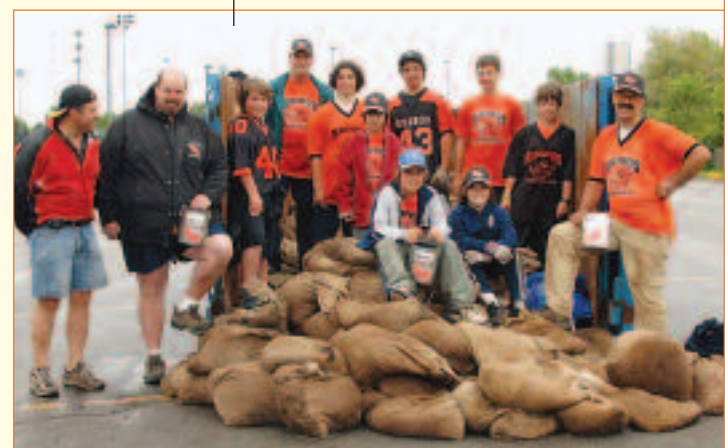
Les Rhinos de Lanaudière étaient présents en grand nombre à l'école secondaire Jean-Baptiste-Meilleur pour cette opération de remise de compost.