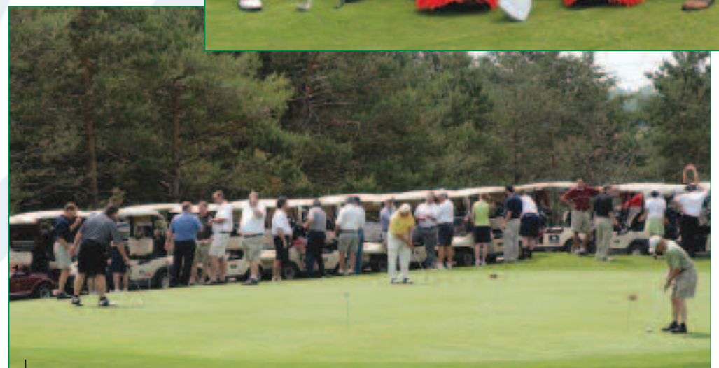
Tout près de 300 golfeurs ont participé à ce tournoi dont les profits sont versés à la Société de développement social, culturel et sportif de Repentigny.