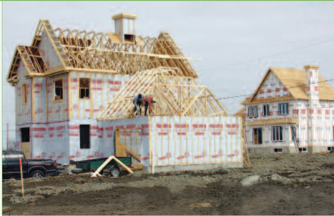
La construction domiciliaire à Repentigny est toujours en pleine effervescence.

Pourtant, les récentes données fournies par la Société canadienne d'hypothèque et de logement (SCHL) indiquent que le nombre de mises en chantier au Québec a chuté de 25 pour cent en avril, en raison principalement d'un net ralentissement de la construction résidentielle dans la région de Montréal. Et tous les experts s'entendent pour dire que la tendance baissière de la construction est bien enclenchée.