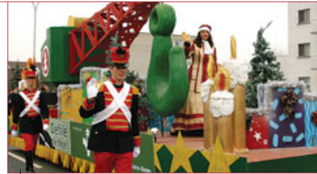
Couleurs, magie et féerie de Noël étaient au rendez-vous !