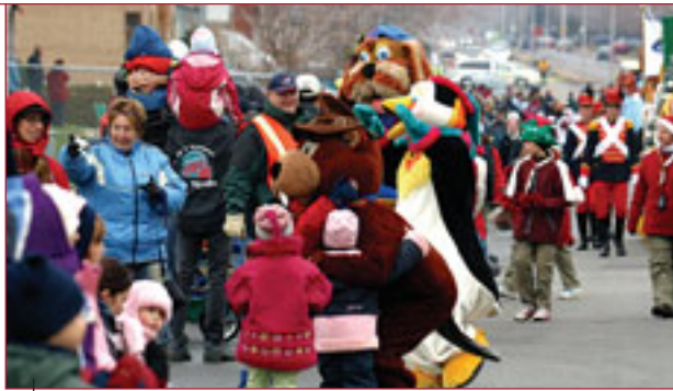
Un défilé hautement apprécié par le grand public.

Tout droit arrivé du pôle Nord, le Père Noël est entré dans la ville par la rue Notre-Dame sous les yeux écarquillés des tout-petits.