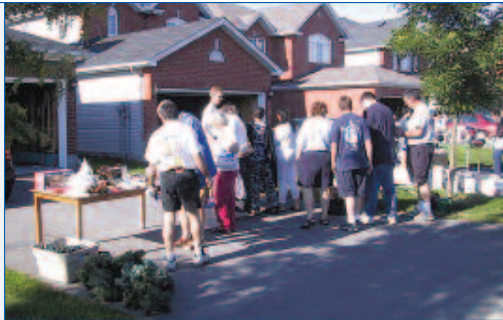
Au printemps dernier, plus de 150 ventes de garage ont été tenues en sol repentignois.

Aucun permis n'est requis. C'est donc gratuit !