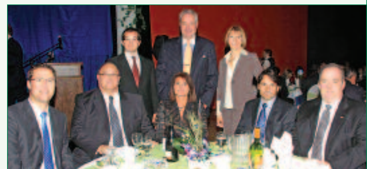
Plus de 350 personnes ont assisté à cet événement prestigieux présenté par la Ville de Repentigny. Voici la table d'honneur.