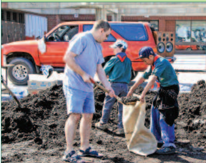
Plus de 250 tonnes de compost seront distribuées cette année !

La remise de compost annuelle est de retour et vous offre en plus, pour une seconde année consécutive, des pousses d'arbres tout à fait gratuitement. L'activité se tiendra dans les stationnements des écoles secondaires Horizon et Jean-Baptiste-Meilleur, le 10 mai prochain, de 8 h 30 à 15 h.