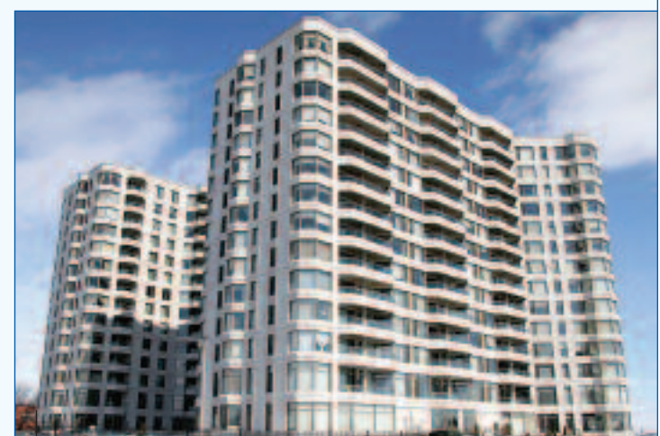
En 2007, Repentigny a connu une excellente année au chapitre de l'immobilier. Pas moins de 668 unités d'habitation ont été construites sur le territoire.

« En 2005, notre ratio d'endettement était à 4,20 %. Au 31 décembre 2007, il s'est établi à 3,75 % (on obtient ce résultat en divisant l'endettement à long terme par la richesse foncière uniformisée). La tendance des trois dernières années s'est confirmée en 2007, alors que le poids de la dette s'est allégé. Notre excellente situation financière démontre que notre administration a su planifier efficacement ses investissements et préparer notre avenir », a conclu la mairesse de Repentigny.