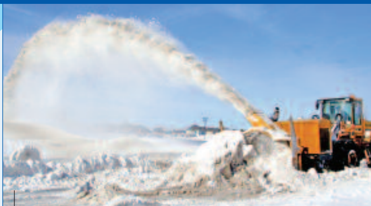
En raison de l'abondance de la neige, la Ville a dû aménager un site temporaire à l'extrémité est de son territoire.

Pas moins de 10 opérations de chargement ont été nécessaires cette année. Au grand total, 320 000 mètres cubes de neige ont été acheminés au site régional de Mascouche et 20 000 autres au site temporaire aménagé dans l'est du territoire