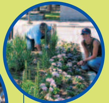
Journalier aux travaux publics ou aux parcs et espaces verts, un emploi tout indiqué pour échapper à la routine !