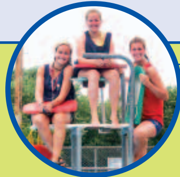
Quoi de mieux que de profiter de la saison chaude au bord de la piscine ! C'est ce que la division aquatique propose aux sauveteurs certifiés !