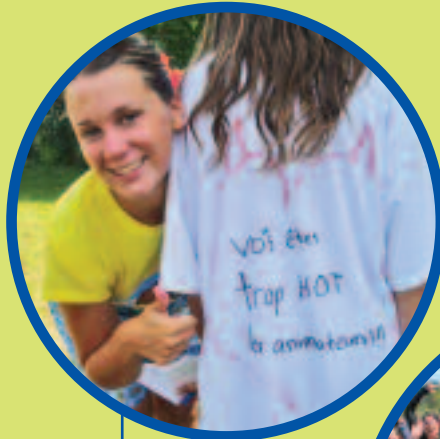
Animateur, un travail valorisant et des journées remplies de soleil !