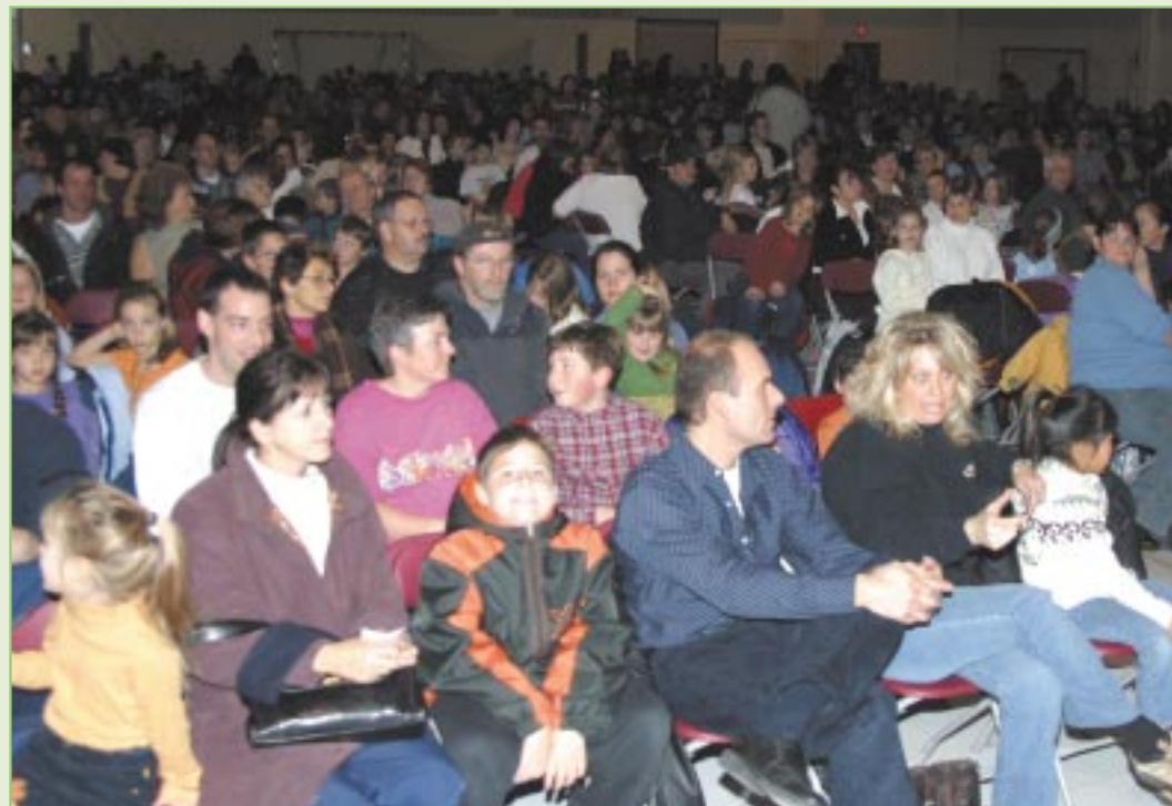
Un peu plus de 1300 personnes ont assisté à cette soirée où les mesures d'urgence et la sécurité civile étaient à l'honneur.

Rappelons que l'année dernière, le Service de sécurité publique de la Ville de Repentigny a remporté le Mérite québécois de la sécurité civile, catégorie formation et information, pour son projet As-tu ta trousse d'urgence , présenté à pareille date l'année dernière dans les écoles primaires de Repentigny et de Charlemagne.