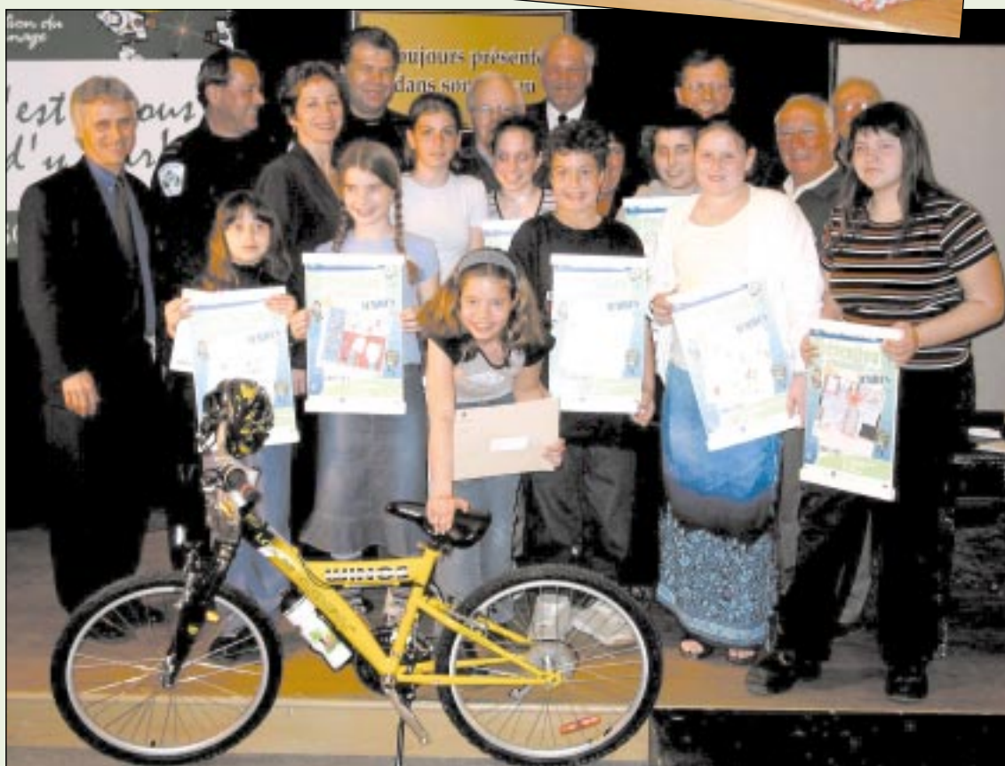
Tous les gagnants en compagnie des collaborateurs, des commanditaires et des dirigeants du programme Protection du voisinage .